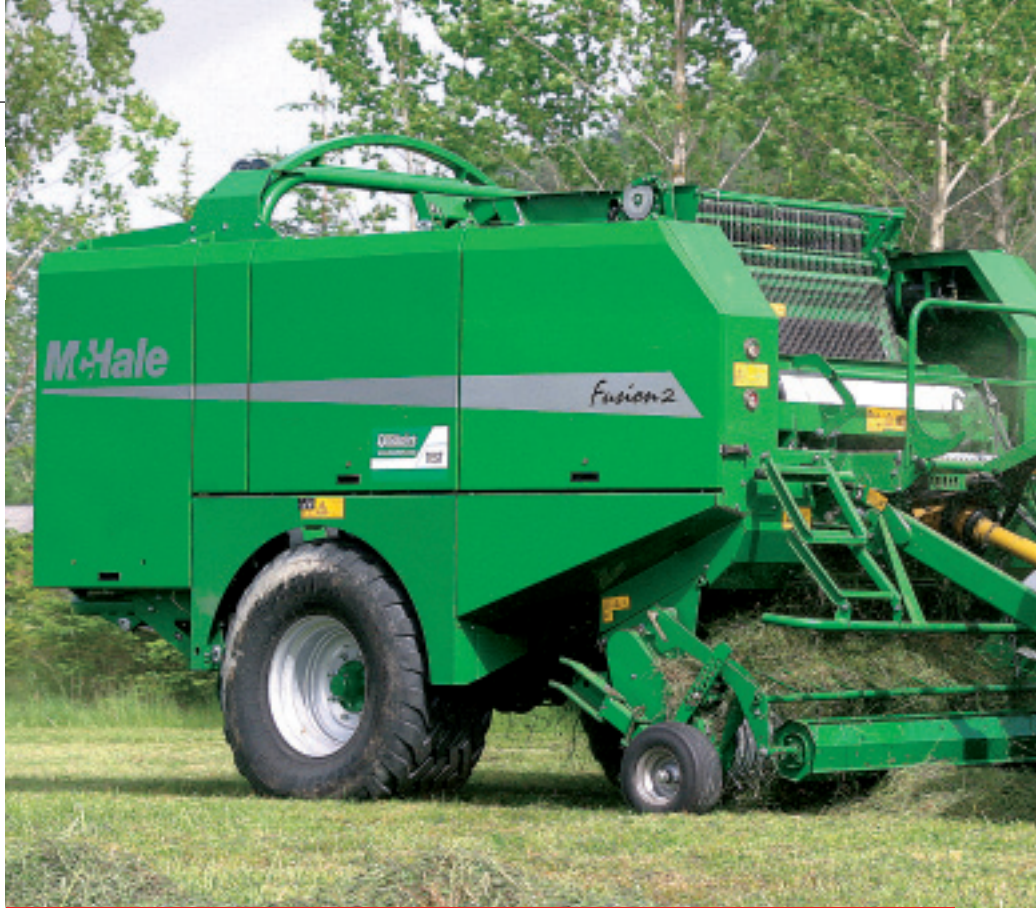
Vergleichstest McHale FUSION 1 – FUSION 2

Auf der Agritechnica im November 2007 präsentierte McHale die zweite Generation seiner Press-Wickelkombination Fusion mit einer Reihe von Verbesserungen. Unser Vergleichstest zwischen der Fusion 1 und der Fusion 2 zeigt, was diese angekündigten Verbesserungen in der Praxis und auf dem Prüfstand wert sind.