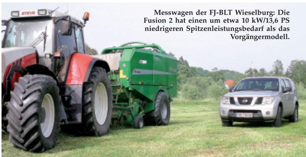
Messwagen der FJ-BLT Wieselburg: Die Fusion 2 hat einen um etwa 10 kW/13,6 PS niedrigeren Spitzenleistungsbedarf als das Vorgängermodell.

te Ballenübergabe funktioniert am Hang noch sicherer.